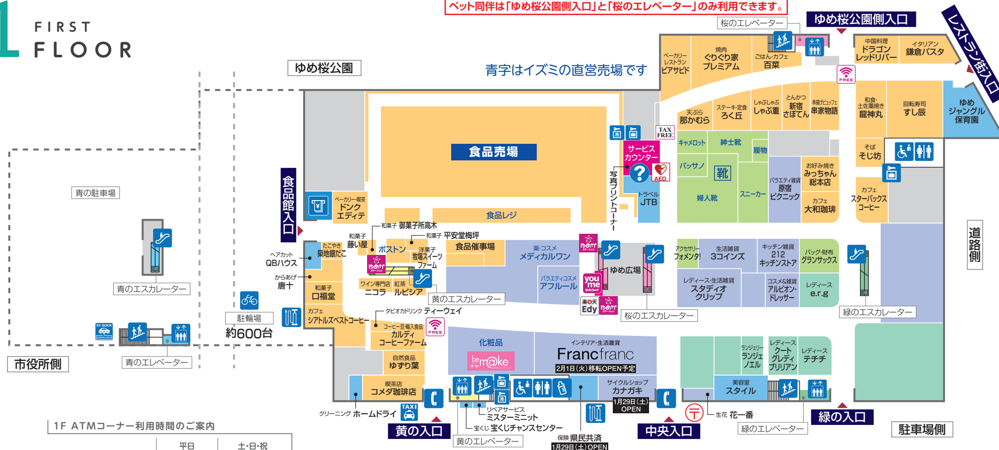
1F ATMコーナー利用時間のご案内